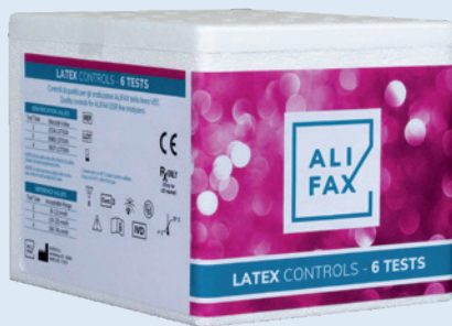
Kit de control de látex con 6 pruebas

Tres niveles para asegurar: Precisión, exactitud y repetibilidad