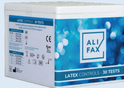
Kit de control de látex con 30 pruebas