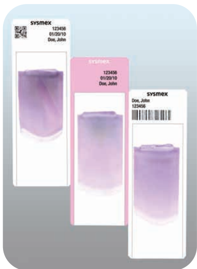
Múltiplas opções de identificação do paciente

Unidade totalmente automatizada e integrada para preparo e coloração de lâminas - esfregaços de alta qualidade com consistência e confiabilidade