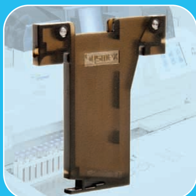
Sistema exclusivo de aplicação do corante que reduz desperdício