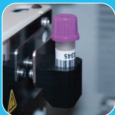
Exclusiva unidade de análise de microamostras