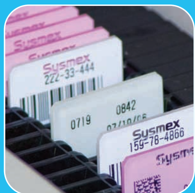
Diferenciação visual de lâminas de urgência (STAT)